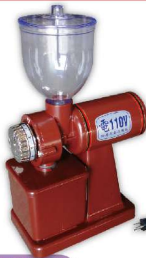
研磨粉碎、藥材加工設備

USK-81L 落地型堅果/芝麻/花生粉機 尺寸：42x78x110cm 滾輪尺寸：Ø88x210mm 馬力：1HP 用途：可改壓芝麻粉、花生粉、穀類雜糧壓碎