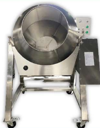
USK-123A 單層炒食機 Ø85

尺寸：128x130x163cm 桶尺寸：Ø75x75cm 馬力：1HP+0.5HP 入口：Ø52cm 產量：60kg 容量：200L