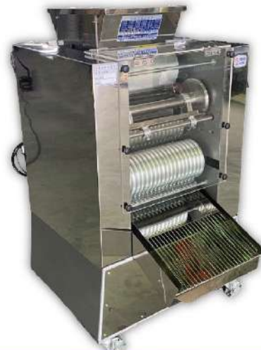
USK-07L 大型全自動湯圓機

尺寸：50x38x77cm 重量：78kg 馬力：1/2HP 輪寬：Ø11x33cm 規格：6-35mm 用途：粉圓、波霸、小湯圓、藥丸