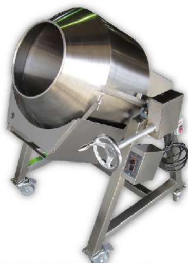
USK-67A 單層炒食機 Ø55

尺寸：74x74x110cm 桶尺寸：Ø50x55cm 入口：Ø30cm 馬力：90W 產量：12kg 容量：60L