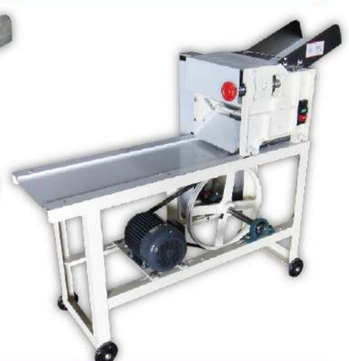
USK-98 落地型壓麵機(長桌)