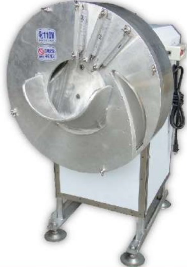
USK-22 筍絲機 尺寸：68x50x83cm 馬力：1HP 入口：Ø19cm 切絲尺寸：3mm(可訂製其他尺寸) 用途：番薯、芋頭、筍子、蘿蔔、瓜類、切絲、切片