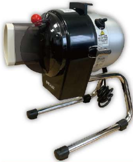
USK-21J 日本桌上型薑絲機 尺寸：23x34x37cm 入口尺寸：95x38mm 重量：5kg 1.2mmx1.2mm絲