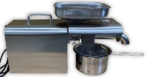
研磨粉碎、藥材加工設備