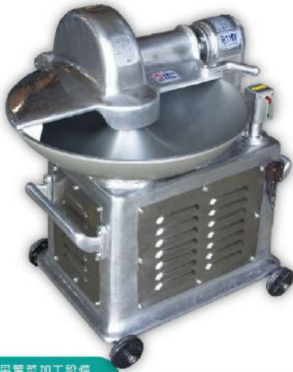
蔬果葉菜加工設備