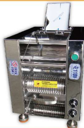
USK-75 桌上型全自動粉圓機

尺寸：39x26x41cm 重量：38kg 規格：2分、2.5分、3分 用途：粉圓、波霸、小湯圓、藥丸