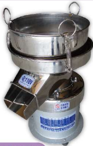
研磨粉碎、藥材加工設備

尺寸：46x16x28cm 重量：10kg 輸出功率：300-800W 最大功率：1500W 用途：芝麻、花生、亞麻、葵花子、南瓜子、穀物雜糧榨油