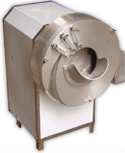
USK-21 薑絲機 尺寸：40x54x56cm 馬力：1/2HP 重量：45kg 用途：切絲、切片 切絲尺寸：1.5mm(可訂製其他規格) 切片尺寸：1.5mm(可訂製其他規格)