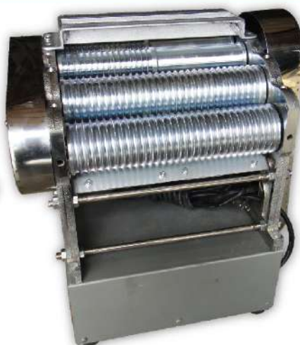
USK-08 桌上型半自動製丸機

尺寸：38x25x26cm 規格：2分、2.5分、3分 用途：粉圓、湯圓、藥丸 滾輪寬：25cm