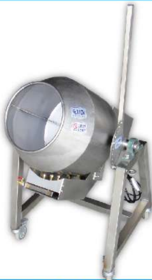
USK-72 單層炒食機 Ø38

尺寸：60x65x74cm 重量：33kg 產量：2kg 內桶尺寸：Ø30x30cm 用途：炒飯、炒麵、炒菜