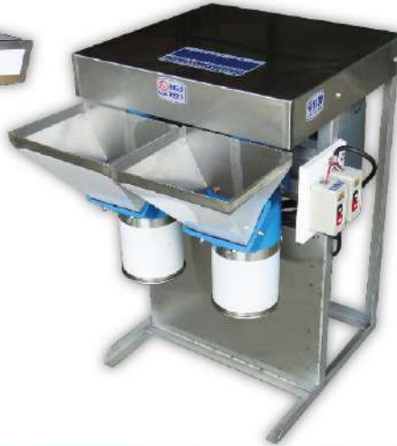
USK-27 蒜蓉機 2孔

尺寸：38x95x104cm 馬力：2HP(60支刀葉) 產能：600-800kg/時 用途：蒜頭、薑、洋葱、蘿蔔、粉圓、味精、油蔥、打碎