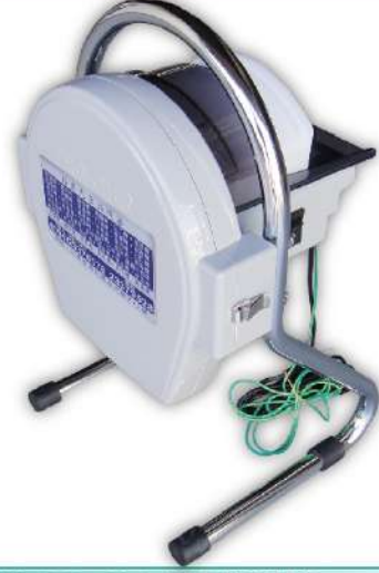
USK-129 日本桌上型切絲機 尺寸：31x28x51cm 重量：7kg 用途：高麗菜、洋蔥、蔬菜、切片、切絲 切片厚度：0.5-0.8mm