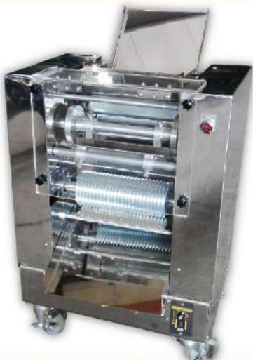
USK-07 落地型全自動粉圓機

尺寸：44x32x53cm 馬力：60Wx2顆 規格：3分 重量：41.5kg 產能：1小時20-30kg