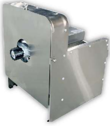
USK-103C 經濟型桌上切菜機 尺寸：34x38x43cm 馬力：40W 切片厚度：0-10mm(可自行調整厚薄) 推料槽尺寸：22x10x14cm 用途：蔬果類切片