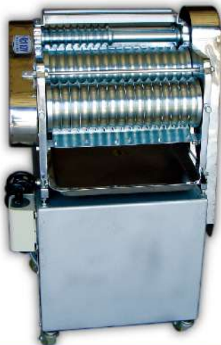
USK-12 落地型半自動湯圓機

尺寸：55x53x88cm 馬力：60Wx1顆、90Wx1顆 產量：1小時50kg 規格：2分、2.5分、3分