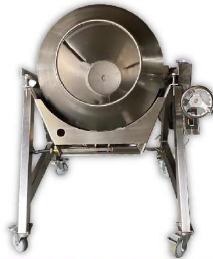
USK-117A 單層炒食機 Ø65

尺寸：106x91x120cm 桶尺寸：Ø60x65cm 入口：Ø35cm 產量：25kg 容量：120L