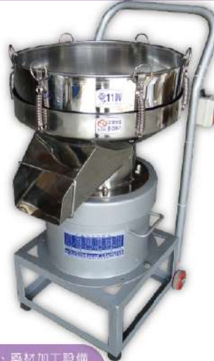
研磨粉碎、藥材加工設備

尺寸：32x38x58cm 篩網尺寸：Ø295x125mm 馬力：1/4HP 重量：21kg 用途：麵粉、粉體、藥粉顆粒篩選、濾豆漿