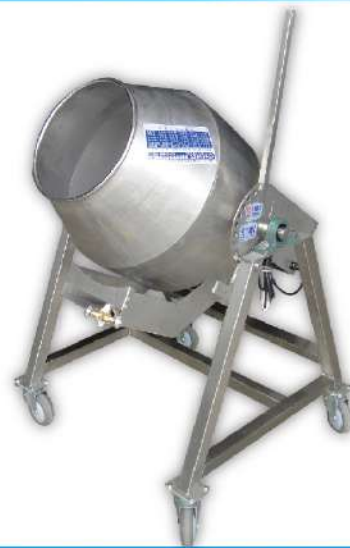
USK-67 單層炒食機 Ø50

尺寸：77x59x114cm 桶尺寸：Ø38x43cm 入口：Ø24cm 馬力：60W 產量：6kg 容量：38L