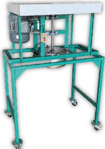
USK-09H 米苔目機(加皮帶蓋)

尺寸：102x69x145cm 馬力：1HP 桶子尺寸：Ø30x15cm 規格：Ø4或5mm