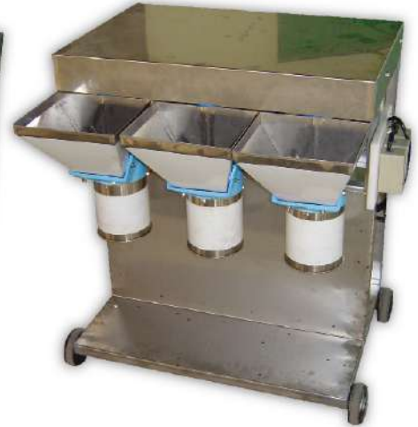
USK-28 蒜蓉機 3孔