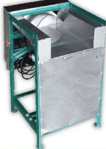
USK-24 高麗菜切絲機 尺寸：47x52x73cm 馬力：120W 重量：25kg 入口尺寸：26x11cm 用途：高麗菜、洋蔥、蘿蔔切絲 或 蘿蔔、苦瓜、筍子、黃瓜切片