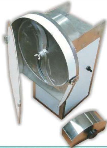
USK-103 桌上白鐵高麗菜切絲機 尺寸：33x28x50cm 電壓：110V 刀盤：Ø27cm 出口離地：17cm 入口：18x9cm 重量：13kg 切片厚度：0.5-4mm(固定型) 用途：高麗菜、洋蔥、蘿蔔切絲 或 蘿蔔、黃瓜切片