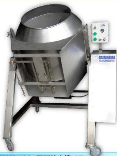
USK-123 單層炒食機 Ø75

尺寸：130x115x133cm 桶尺寸：Ø65x73cm 入口：Ø39cm 產量：40kg 容量：160L