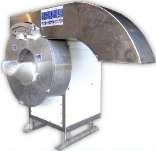
USK-23 薯條機 尺寸：100x65x80cm 馬力：1.5HP 入口：Ø22cm 切條尺寸：10 3 mm或12 3 mm (切條長度取決食材本身長度)