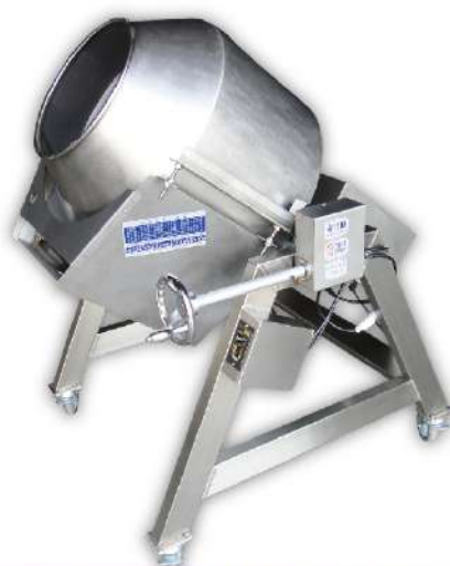
USK-117 單層炒食機 Ø60

尺寸：84x94x118cm 桶尺寸：Ø55x59cm 入口：Ø33cm 產量：20kg 容量：80L