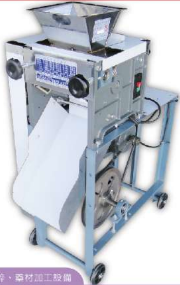
研磨粉碎、藥材加工設備

USK-81L 落地型堅果/芝麻/花生粉機 尺寸：42x78x110cm 滾輪尺寸：Ø88x210mm 馬力：1HP 用途：可改壓芝麻粉、花生粉、穀類雜糧壓碎