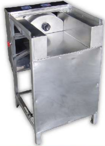
USK-24S 白鐵高麗菜切絲機 尺寸：47x52x73cm 馬力：120W 重量：25kg 入口尺寸：26x11cm 切片厚度：0.5-20mm (固定型)